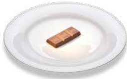
Молочный шоколад Vollmilchschokolade

Брошюра служит исключительно для иллюстрации и не заменяет подробное обучение у специалиста по диабету.