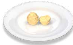
Молочное мороженое Milchspeiseeis