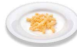
Макаронные изделия (вареные) Nudeln (gekocht)

*Изображения служат исключительно для визуальной наглядности приблизительного количества углеводных единиц (XE) и могут отличаться от данных таблиц для перерасчета XE. Используйте точные данные для перерасчета продуктов питания в XE исключительно из таблиц, приведенных на предыдущих страницах.