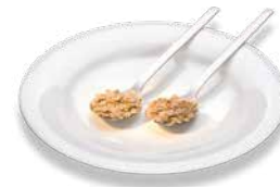
Овсяные хлопья (2 ст.л.) Haferflocken (2 EL)