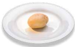
Картофель (вареный) Kartoffel (gekocht)