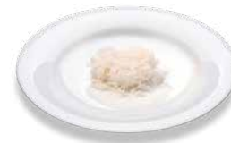
Рис (вареный) Reis (gekocht)