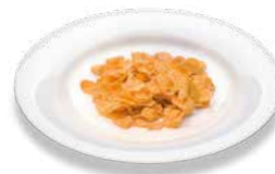
Кукурузные хлопья Cornflakes