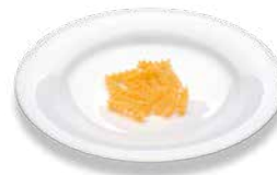
Макаронные изделия (сырые) Nudeln (ungekocht)