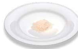
Рис (сырой) Reis (ungekocht)