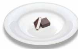
Птичье молоко Schaumzuckerkonfekt