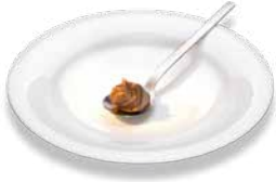
Орехово-нугатный крем (1 ст.л.) Nougatcreme (1 EL)