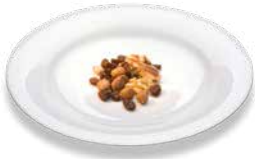
Смесь орехов, изюма, сухофруктов Studentenfutter