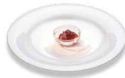
Конфитюр из клубники Erdbeermarmelade