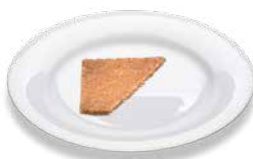
Ржаной хлеб из муки грубого помола Vollkorn-Roggenbrot