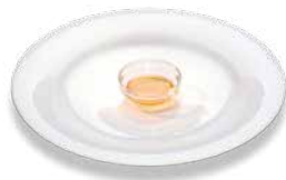
Пчелиный мед Bienenhonig