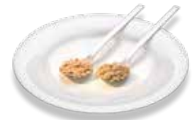
Haferflocken (2 EL)