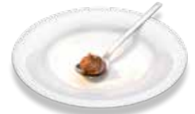
Nuss-Nougat-Creme (1 EL)