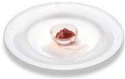
Strawberry jam Erdbeerkonfitüre