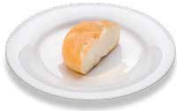
Bread roll Brötchen