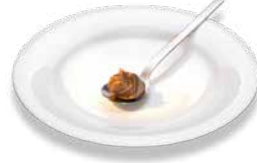
Nut-nougat spread (1 tablesp.) Nuss-Nougat-Creme (1 EL)

This brochure is for illustration purposes and does not replace detailed training by a diabetes specialist. Diese Broschüre dient der Illustration und ersetzt eine ausführliche Schulung durch eine Diabetes-Fachkraft nicht.