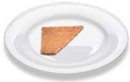
Wholemeal rye bread Roggenvollkornbrot