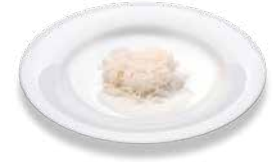
Rice (boiled) Reis (gekocht)