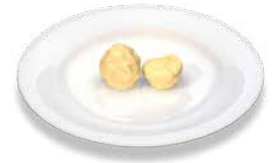
Ice cream Milchspeiseeis