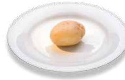
Potatoes (boiled) Kartoffeln (gekocht)