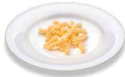
Pasta (boiled) Teigwaren (gekocht)