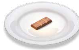
Whole milk chocolate Vollmilchschokolade