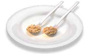
Rolled oats (2 tablesp.) Haferflocken (2 EL)