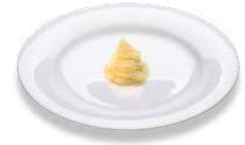
Potatoes (mashed) Kartoffelüree