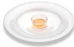
Natural honey Bienenhonig