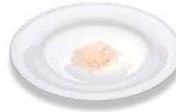
Rice (raw) Reis (roh)