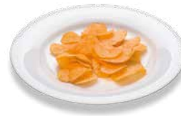
Potato crisps Kartoffelchips