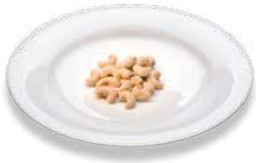
Cashew nuts Cashewnüsse