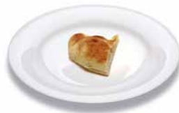
Pita bread Fladenbrot