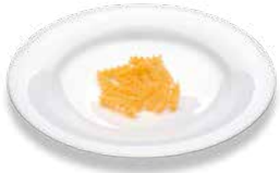
Pasta (raw) Teigwaren (roh)